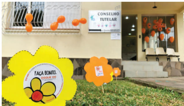
Município conta com rede de proteção para atendimento das vítimas

Além de pensar e executar ações relacionadas ao enfrentamento de todas as formas de violência contra crianças e adolescentes, o comitê também é responsável pelo fluxo de atendimento e proteção das vítimas. Dependendo de